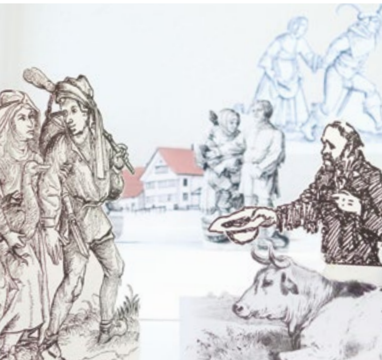
Illustration: Simone Bissig

Ces exploitations-tests permettent également de jauger les capacités des étudiants en agriculture à voler de leurs propres ailes. En Hollande, par exemple, une école d'agriculture biodynamique met la ferme du Warmonderhof, qui s'étend sur 18 hectares, à disposition de deux à quatre étudiants qui s'en occupent durant une année. Ils sont conseillés par un agriculteur voisin et empruntent des machines dans les fermes aux alentours, mais ce sont eux qui gèrent les affaires courantes, qui achètent les intrants et qui vendent leur production.